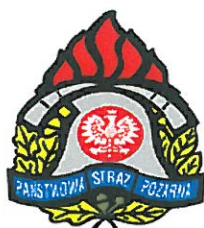
KP PSP Olecko