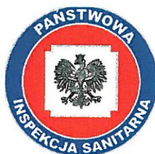
PSS – E Olecko