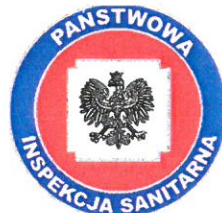
PSS – E Olecko