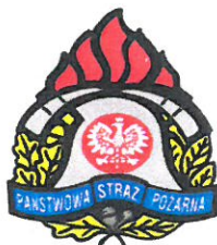
KP PSP Olecko